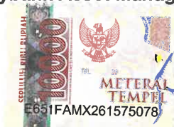
Sopar Broin Situmorang Direktur